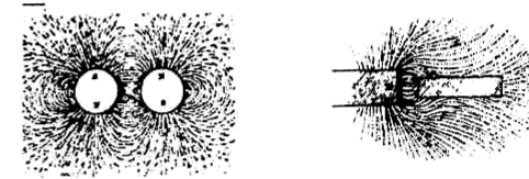
Figura 1. Representação dos fenômenos elétrico e magnético por linhas de campo.

Faraday acreditava que a natureza da ação elétrica ou magnética estava além do alcance dos experimentos. Ele evitou essa discussão definindo essa ação como ocorrendo entre as partículas “contíguas” de um meio material: uma ação contígua afeta cada partícula sucessivamente, sem deixar de lado qualquer partícula. Faraday pensava em termos de linhas de força para representar a ação magnética pois “todos os pontos estabelecidos experimentalmente a respeito de tal ação, isto é, todos que não são hipotéticos, parecem ser bem e verdadeiramente representados por elas.”